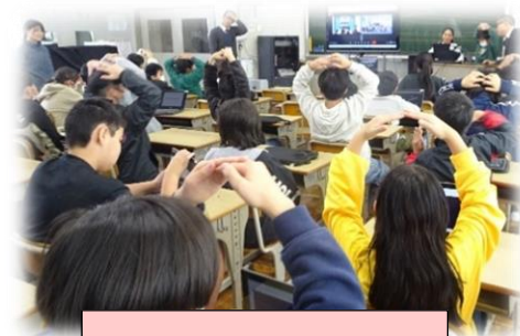
台湾とのオンライン交流

私はあさなん子の授業の様子を時々見て回っていますが、友達と話し合いをしたり、グループで意見をまとめたりして、友達とすごく良い関係ができているなと感じました。「友達の話をよく聞いて、友達の良さを認め、仲間と協力して困難を乗り越える」が実践できた2学期だったと思います。とても充実した2学期が送れたのではないのでしょうか。