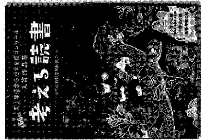
※第66回作品集(昨年度)